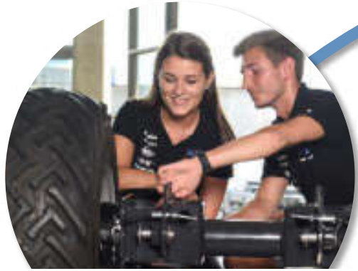
Maschinenbau und Werkstofftechnik