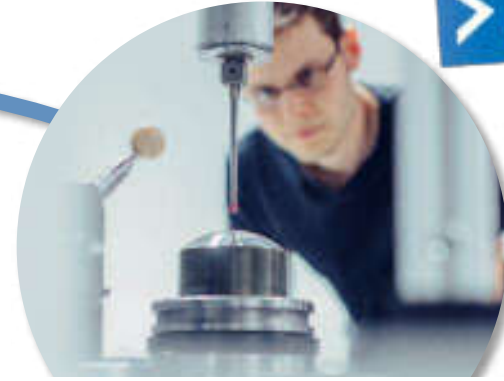
Optik und Mechatronik