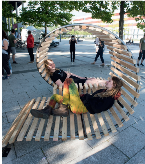
Studentinnen entspannen im »Leselooping« auf dem Forum am Zentralcampus in Cottbus. Entworfen haben dies Architektur-Studierende im Rahmen einer eigenen Kunstaktion

Während des gesamten Studiums erhalten dual Studierende eine monatliche Vergütung und sind somit finanziell abgesichert. Für ein duales Studium bewerben sich Interessierte zunächst direkt bei den Kooperationspartnern. Nach dem Bewerbungsverfahren beim Unternehmen erfolgt die Bewerbung an der BTU.