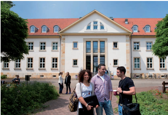
Studierende vor dem Gebäude 7, in dem sich die Musikpädagogik und die Hochschulbibliothek auf dem Campus Cottbus-Sachsendorf befindet

Darüber hinaus bieten die Zentrale Studienberatung sowie das BTU-College ganzjährig weitere Angebote und Projekte an. Neben individuellen und persönlichen Beratungsgesprächen sind zum Beispiel folgende Formate für Schülerinnen und Schüler, Schulklassen, aber auch für Eltern und Lehrer_innen verfügbar: Campustage, Frühstudium, Tage der offenen Tür, Biotechnologietage, Naturwissenschaftstage, Experimentier-Workshops in unseren Schülerlaboren, BTU on Tour-Vorträge und Workshops an den Schulen.