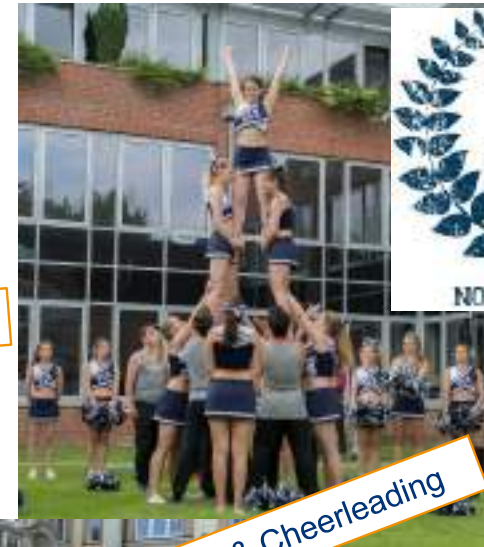
Sport & Cheerleading