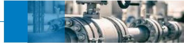
Kugelhähne, Leegebruch (demnächst Berlin)