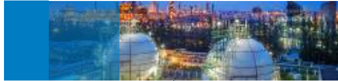
BORSIG Zentrale, Berlin