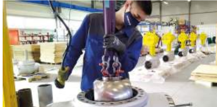
Industriemechaniker Instandhaltung (m/w/d)