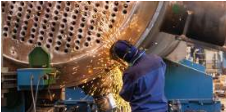
Anlagenmechaniker Anlagenbau (m/w/d)