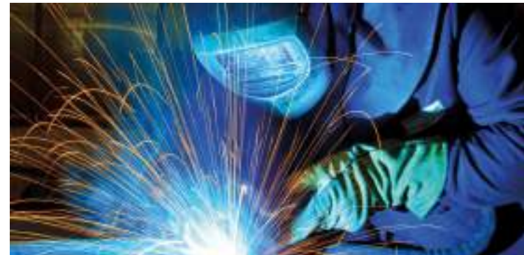
Anlagenmechaniker Schweißtechnik (m/w/d)