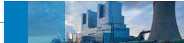
Kraftwerksservice und Anlagen-Engineering, Berlin